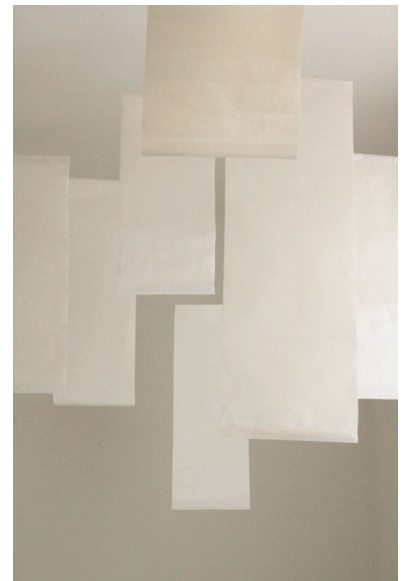
Travail d'installation sur le papier, réalisé en atelier, 2015